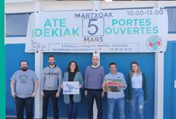
TXIKILINUXEN AURKEZPENA DONIBANEKO IKASTOLAN