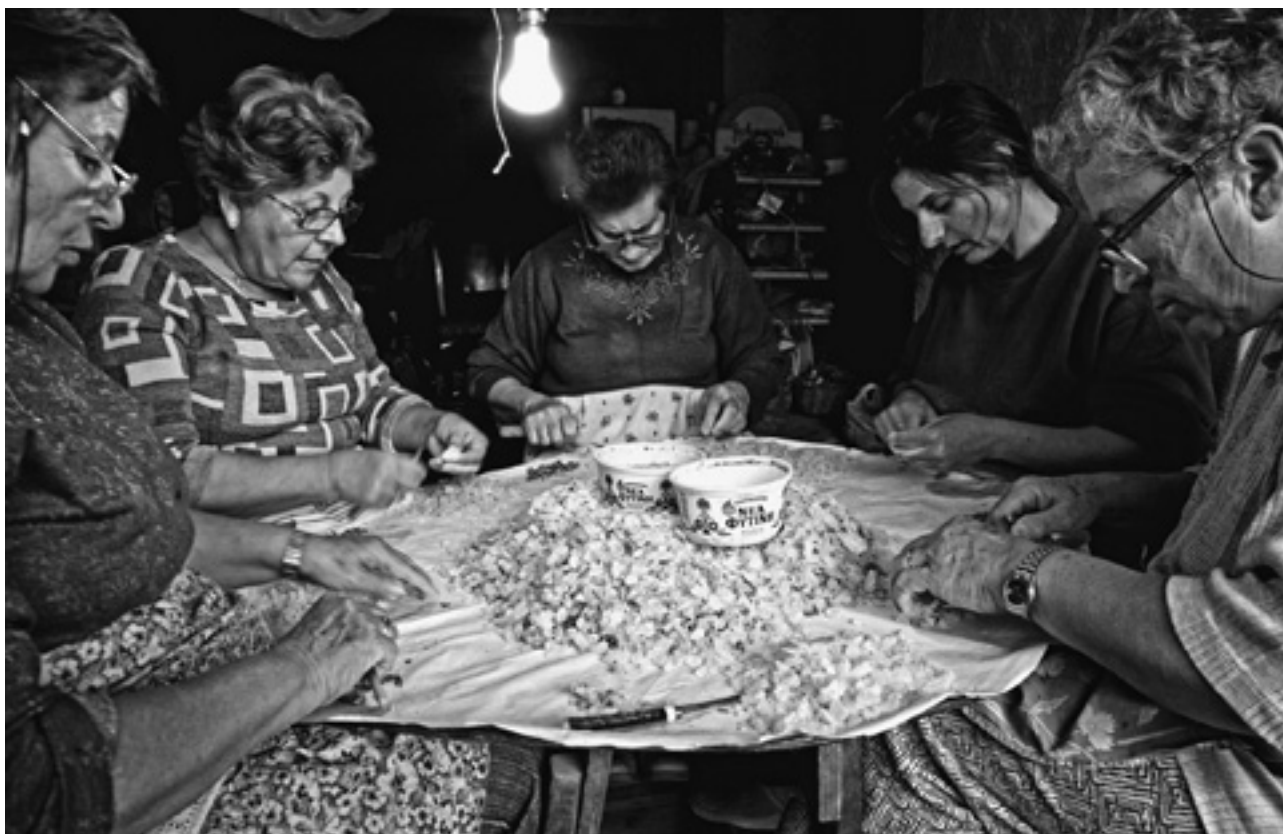
Conocimientos y prácticas del cultivo del mástique en la isla de Quíos, Grecia

sidad de un criterio basado en los derechos humanos en los asuntos relacionados con el patrimonio cultural” 70 . Retomó y profundizó la idea manifestada el año anterior al señalar que “considerar el acceso al patrimonio cultural y su disfrute como un derecho humano es un criterio necesario y complementario de la preservación y salvaguardia del patrimonio cultural. Además de preservar y salvaguardar un objeto o una manifestación en sí misma, obliga a tener en cuenta los derechos de las personas y comunidades en relación con ese objeto o manifestación y, en particular, conectar el patrimonio cultural con su fuente de producción” 71 . Por tanto, señala que para una efectiva participación de la comunidad y de cara a contar con la dimensión humana del patrimonio cultural, deberíamos pasar a un nuevo punto de vista, identificando y protegiendo los bienes que tienen significación para personas y comunidades.