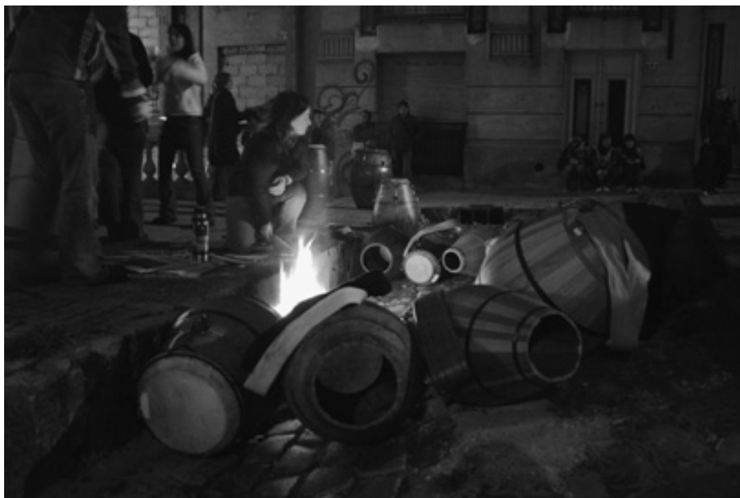
El candombe y su espacio sociocultural: una práctica comunitaria