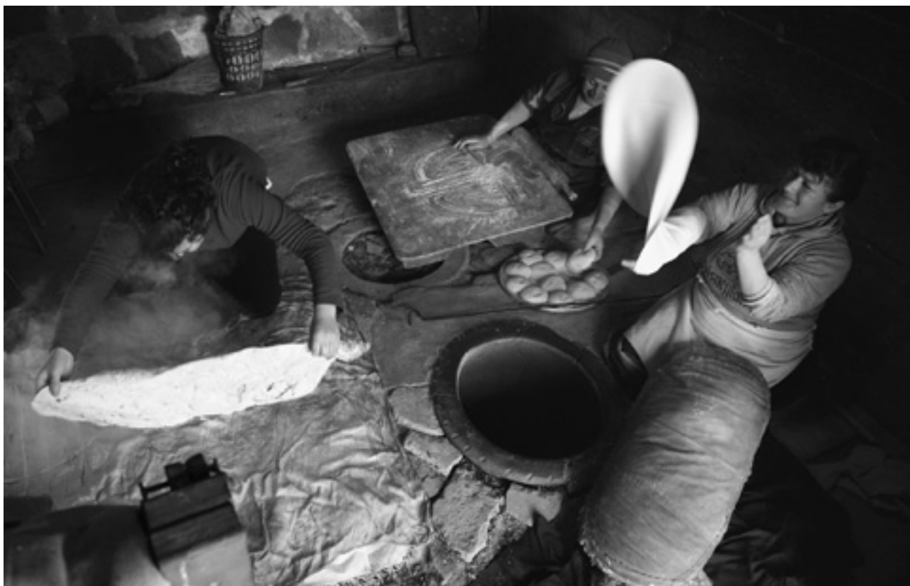
El lavash, preparación, significado y aspecto del pan tradicional en Armenia

A la hora de hacer recomendaciones para implementar un enfoque en derechos en la práctica de las Convenciones de patrimonio, consideramos que sería importante que UNESCO pudiera integrar en los órganos decisorios de ambas Convenciones (1972 y 2003) mecanismos para la participación de diversas instancias de derechos humanos del sistema de Nacio-