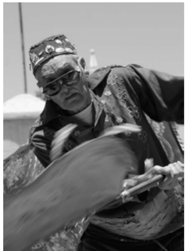
Los bailes chinos son hermandades de músicos que expresan su fe por intermedio de la música, la danza y el canto, con motivo de la celebración de fiestas conmemorativas en Chile

Por supuesto, existen ya ejemplos de participación de comunidades en la gestión de sitios Patrimonio Mundial, como el caso de comunidades indígenas en Laponia y Sudáfrica 104 , entre otros muchos, que podrían ser considerados como modelos a seguir, y donde estas comunidades se conforman como intérpretes de su propio patrimonio, orientando las acciones y participando en la toma de decisiones. Otros ejemplos de participación de la comunidad local, no necesariamente vinculados a pueblos indígenas, deberían dotar de medidas prácticas trasladables a otros contextos (como los ejemplos de paisajes culturales ligados a lo agrario, como la zona cafetera de Colombia 105 o el paisaje agavero en México -el patrimonio agrario