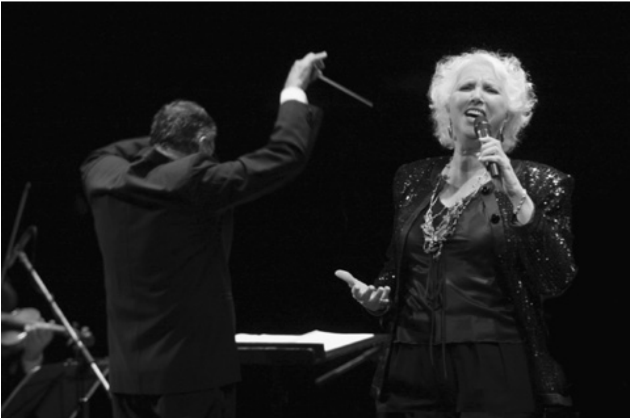
La tradición argentina y uruguaya del tango

nes Unidas, como la Relatora Especial de Derechos Culturales del Consejo de Derechos Humanos o el Comité del Pacto Internacional de Derechos Económicos, Sociales y Culturales (PIDESC). Además, y para casos particulares, sería recomendable también contar con el apoyo del Foro Permanente de Asuntos Indígenas de Naciones Unidas 113 , el Comité de la CEDAW, y otras instancias específicas. Además, la adopción en 2007 de la Declaración de Naciones Unidas sobre los Derechos de los Pueblos Indígenas genera tanto una razón como una oportunidad para que el Comité del Patrimonio Mundial revise su relación con las comunidades indígenas 114 . A su vez, para asegurar la participación de las mujeres en los procesos de implementación de cualquier normativa internacional para la protección del patrimonio, además de los documentos relativos a derechos humanos, se debe prestar atención también a aquellos instrumentos internacionales explícitamente dedicados al análisis y protección de los derechos de la mujer 115 .