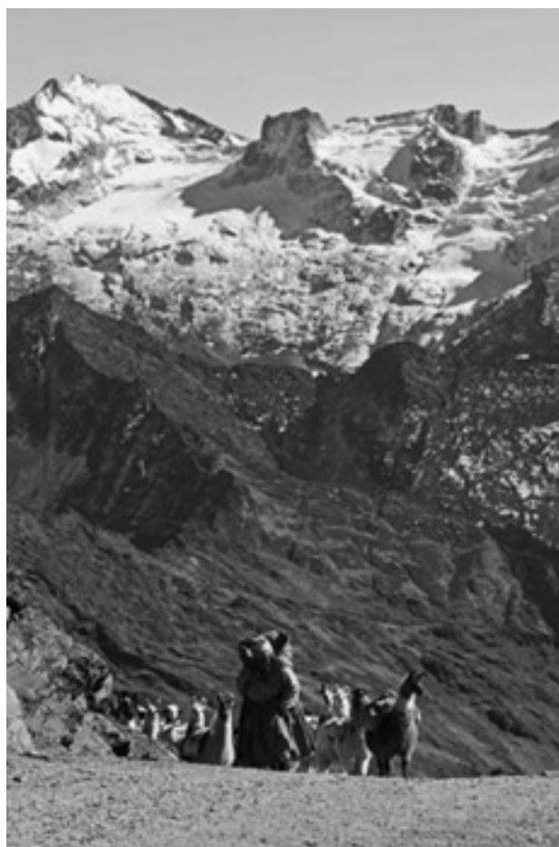
Qhapaq Ñan, Sistema Vial Andino