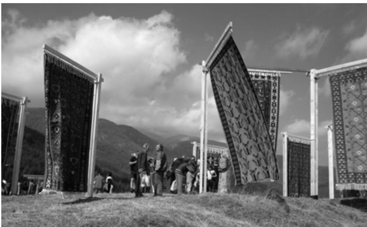
La tradición de la fabricación de alfombras en Tchiprovtsi, Bulgaria

Así pues, frente a la anterior falta de clarificación de los derechos culturales, los procesos mencionados (junto con otros proyectos e iniciativas) generaron en el seno de Naciones Unidas una nueva situación en cuanto al contenido, alcance e implementación efectiva de los derechos culturales 6 . Si bien su evolución y desarrollo requerirá aún más tiempo y procesos a escala internacional y local, el fortalecimiento de los derechos culturales en Naciones Unidas, ha tenido también su repercusión en cómo abordar la gestión del patrimonio -como una de las expresiones más características de la cultura-, desde un enfoque en derechos, como veremos a continuación.