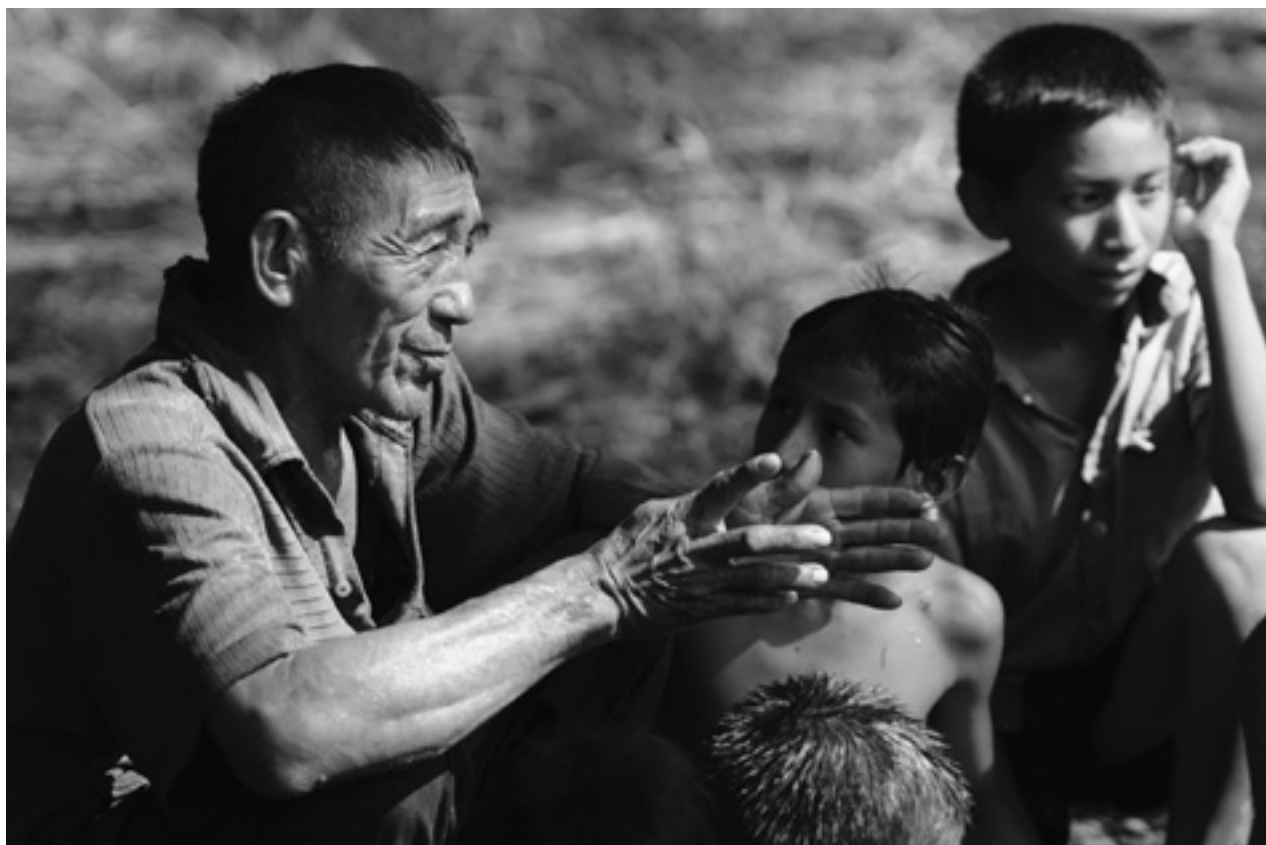
Tradición oral Mapoyo, Venezuela

Indicadores específicos de derechos humanos deberían ser generados para estos procesos de monitoreo y protección, ya que la incorporación de mecanismos de seguimiento y rendición de cuentas de los resultados es parte de las obligaciones de los Estados frente a los titulares de derechos 90 .