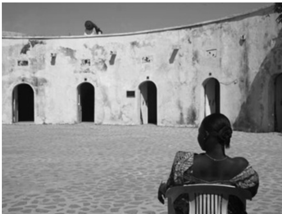
Isla de Gorée (Senegal), centro de comercio de esclavos más importante de las costas africanas entre los siglos XV y XIX

Patrimonio Mundial por su vinculación con hechos históricos claves en materia de derechos humanos. Thingvellir (Islandia) fue reconocido por su significado como predecesor de la democracia parlamentaria y Robben Island (Sudáfrica) aparece no solo como símbolo del derecho de autodeterminación de la gente sudafricana, sino también como emblema de tolerancia y dignidad humana. Gorée (Senegal) se incluyó por su vinculación con la esclavitud y la Ruta de la Seda entró en la Lista como ejemplo de integración y diálogo entre diferentes naciones. Existen también algunos bienes que recuerdan violaciones de derechos humanos cometidas en el pasado, como el campo de concentración y exterminio de Auschwitz, o Hiroshima (Japón). Pero para algunos autores sigue siendo significativo que en estos procesos de memorialización que suponen los reconocimientos internacionales, los derechos humanos no tengan mayor peso como justificación de las inscripciones 25 .