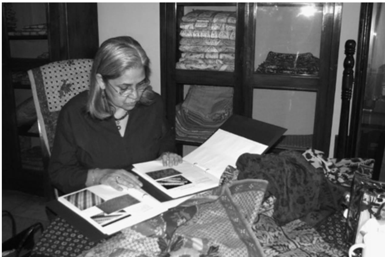
El batik indonesio: técnicas, simbolismo y elementos culturales asociados al tejido de algodón y seda teñido a mano

Sigue siendo real que cuando las mujeres reivindican su derecho a no participar en determinadas costumbres y a interpretar, enmendar y reformar los contornos de sus comunidades culturales suelen toparse con una oposición desproporcionada. Siguiendo a la propia Relatora en su Informe recordamos que “preservar la existencia y la cohesión de una comunidad cultural específica no debe lograrse en detrimento de un grupo de la comunidad, por ejemplo las mujeres. Es importante señalar que la lucha contra las prácticas culturales