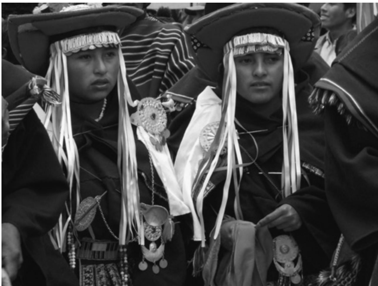
Pujllay y el Ayarichi, músicas y danzas de la cultura yampara, Bolivia

La inclusión de prácticas sociales y rituales como un dominio de la cultura inmaterial a ser protegido por la comuni-