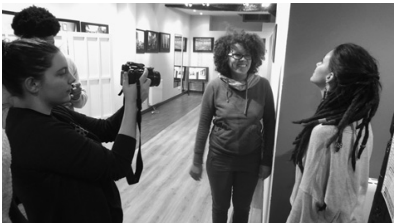
Taller Ventana a la Diversidad en Vitoria - Gasteiz

Además, algunas mujeres sufren no solo la discriminación por género, sino que esta se superpone a otras discriminaciones por origen o etnia, por ejemplo. Así la fragilidad conceptual del marco teórico de los derechos culturales dificulta la articulación política de una agenda práctica que permita a las mujeres pertenecientes a minorías culturales o étnicas tener el derecho a gozar de una vida cultural plena, propia, y a disfrutar de los beneficios de la cultura de su entorno 77 .