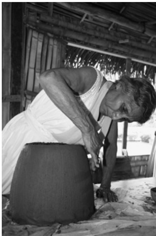
Xtaxkgakget Makgkaxtlawana: el Centro de las Artes Indígenas y su contribución a la salvaguardia del patrimonio cultural inmaterial del pueblo totonaca de Veracruz, México

En torno a la cuestión de los grupos indígenas, debemos afirmar que otros textos normativos de UNESCO han sido también claves para la visibilización de estas comunidades. En 2001, con la Declaración sobre la Diversidad Cultural, se hizo especial hincapié en los saberes tradicionales de pueblos indígenas, que a su vez, también fueron reconocidos por la Convención del Patrimonio Inmaterial en 2003 51 .